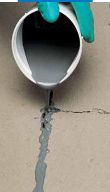
Riparazione crepa di massetto cementizio con Eporip