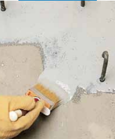
Applicazione di Eporip a pennello per ripresa di getto